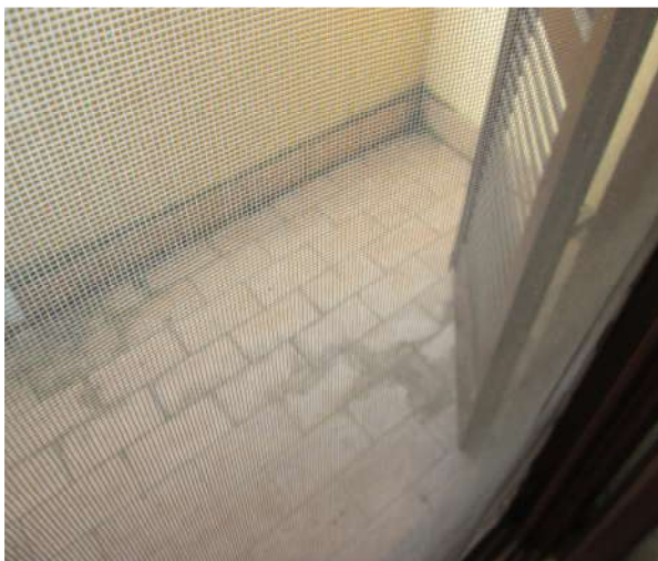
Nell'aggiornamento fotografico del 2024, la presenza della Zanzariera fissa ha impedito l'ispezione.